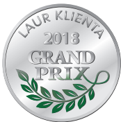
Laur Klienta Grand Prix 2018

Pekao TFI na III miejscu w prestiżowym rankingu towarzystw funduszy inwestycyjnych „Rzeczpospolitej” z 24.10.2019 r.